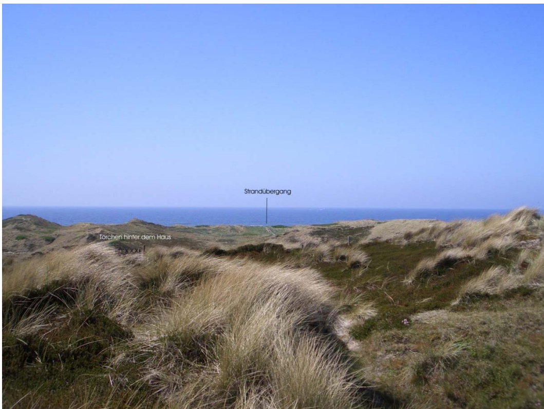
Abbildung 11 Blick zum Weststrand