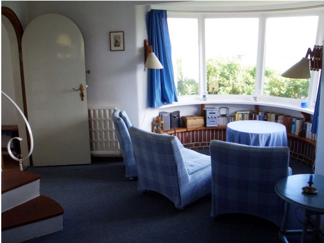
Abbildung 6 Wohnzimmer