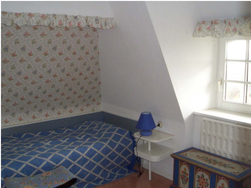
Abbildung 8 Zweibettzimmer