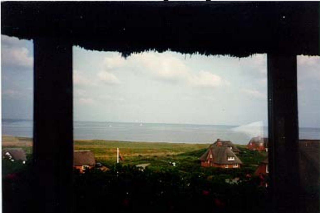
Abbildung 10 Blick aus dem Wohnzimmer auf das Wattenmeer