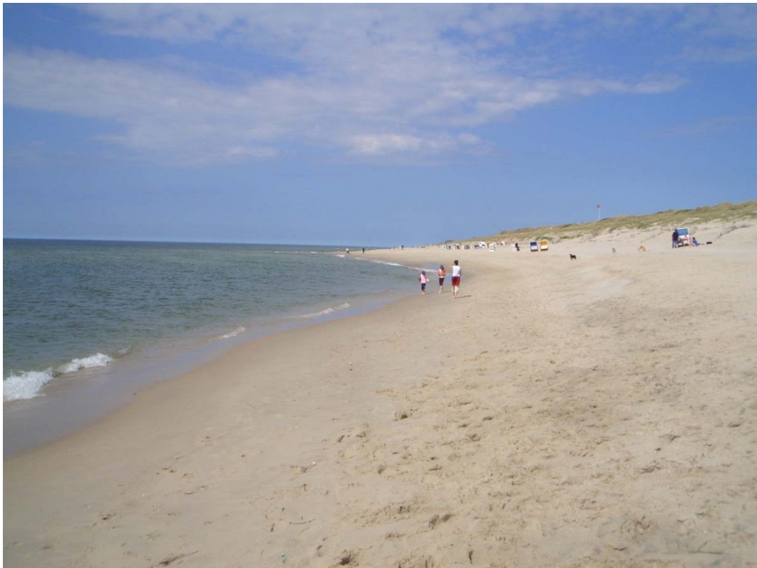
Abbildung 12 Der nahe, wenig frequentierte Badestrand