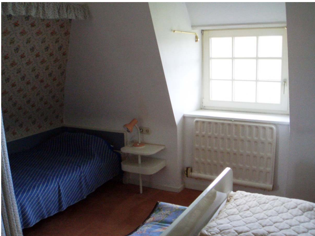
Abbildung 9 Dreibettzimmer