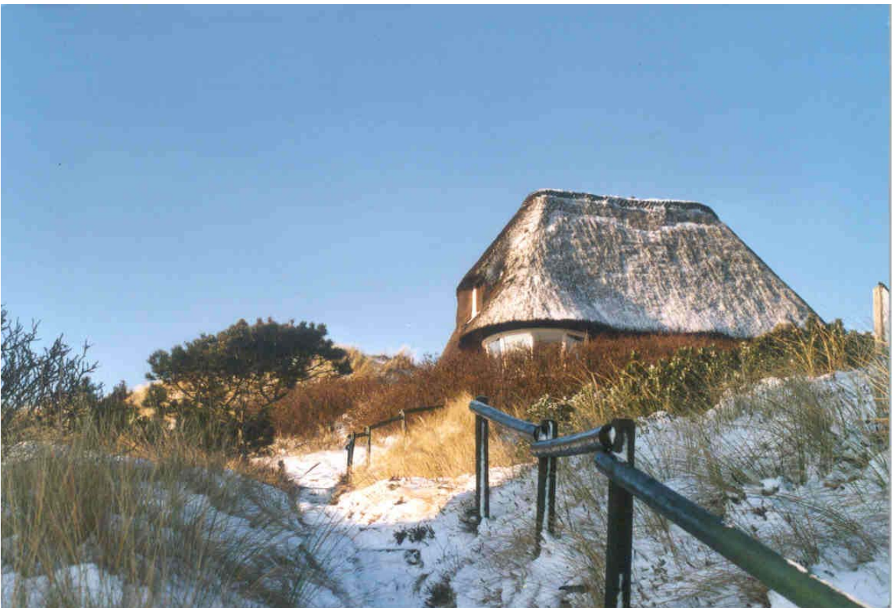
Abbildung 2 und im Winter bei Schnee