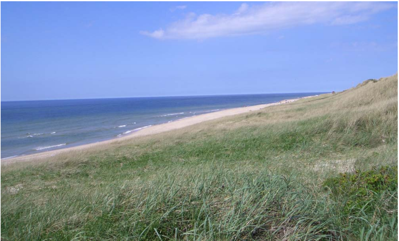
Abbildung 13 Panoramablick von der Düne