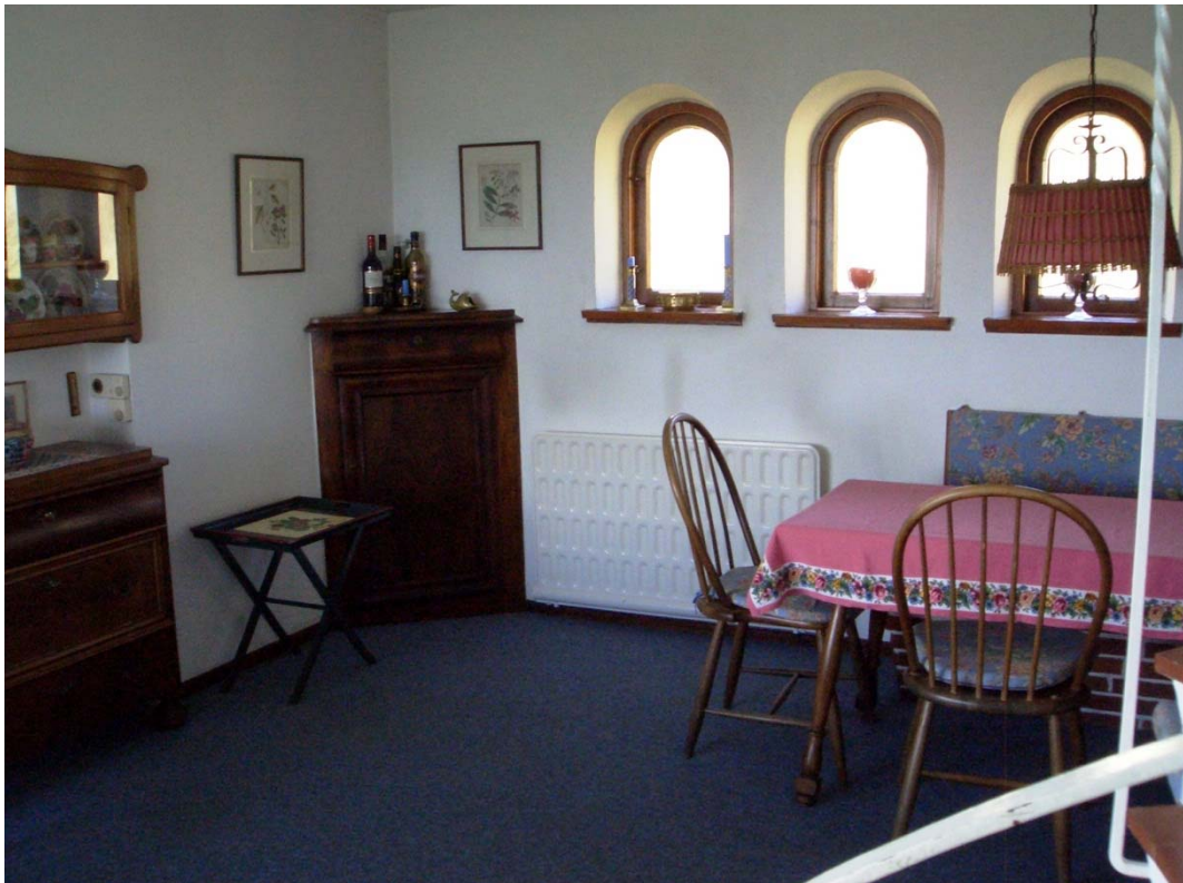
Abbildung 7 Essecke im Wohnzimmer