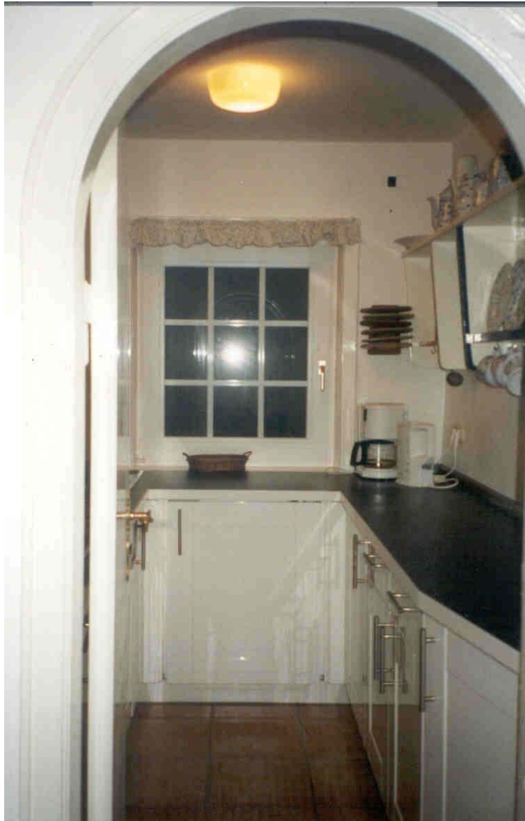
Abbildung 5 Blick in die Küche des Hauses

Das Haus hat drei kleine Schlafzimmer mit 1, 2 und 3 Betten, Dusche-WC, Wohn-Essraum und Küche. Alle notwendigen Elektrogeräte sowie eine Waschmaschine mit Schleuder sind vorhanden.