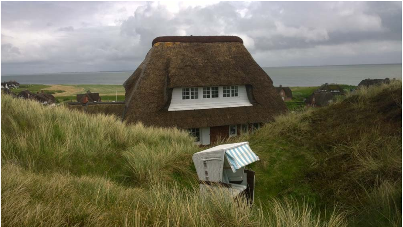
Abbildung 3 Blick auf das Haus von Westen, wenn man vom Meer kommt