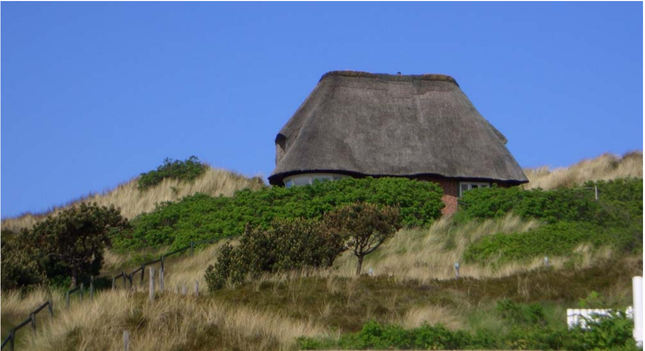
Abbildung 1 Von der Straße (von Osten) auf einer Düne gelegen im Sommer